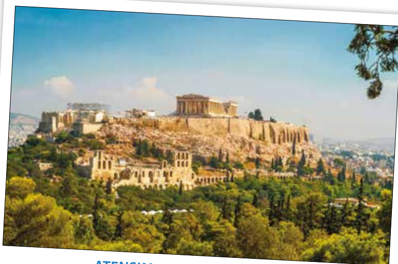
ATENSKA AKROPOLA V GRČIJI 🚗 17 UR IZ LJUBLJANE

NA VRHU HRIBA V GLAVNEM MESTU GRČIJE STOJI AKROPOLA – NEKOČ MOGOČNO NASELJE S ŠTEVILNIMI STAVBAMI. NAJBOLJ ZNAMENIT JE KAMNITI TEMPELJ PARTENON, V KATEREM SO ČASTILI BOGOVE.