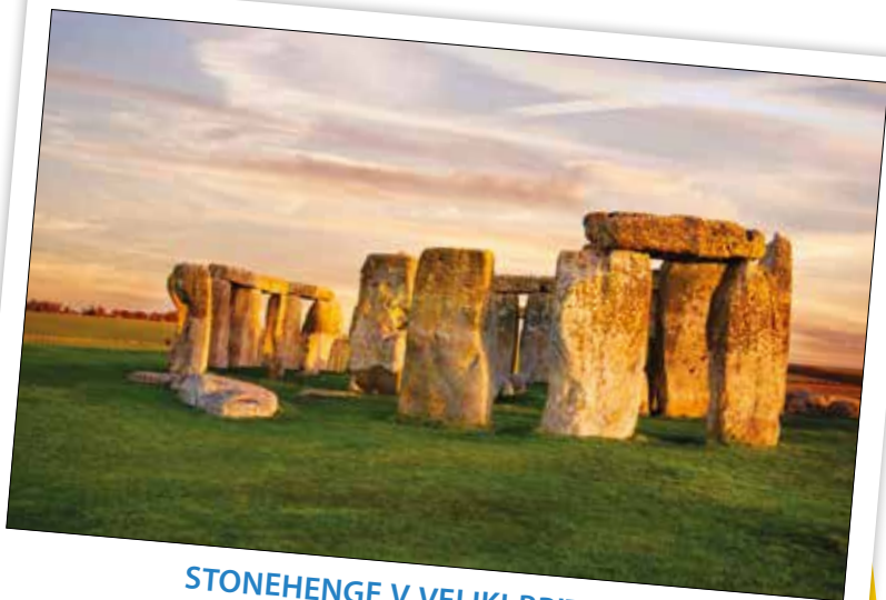
STONEHENGE V VELIKI BRITANIJ 🚗 17 UR IZ LJUBLJANE

Tako velike kamne imenujemo megaliti. Nekateri od teh megalitov so visoki kar 7 metrov. Znanstveniki domnevajo, da je bil ta kamniti krog namenjen verskim obredom in opazovanju zvezd.