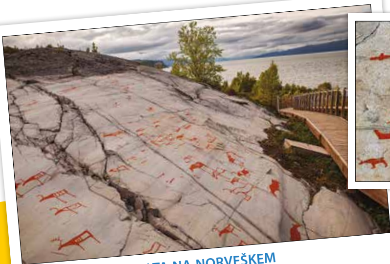
ALTA NA NORVEŠKEM 🚗 39 UR IZ LJUBLJANE