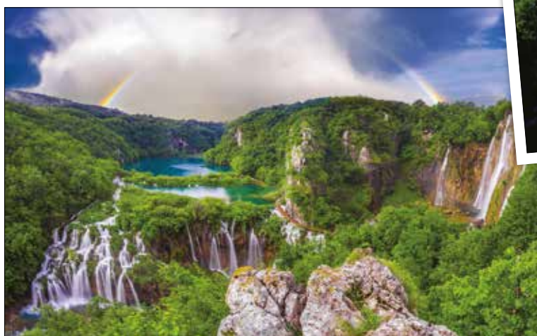
PLITVIŠKA JEZERA NA HRVAŠKEM 🚗 3 URE IZ LJUBLJANE

SI ŽE KDAJ VIDEL/A JEZERA, KJER SE VODA IZ ENEGA PRELIVA V DRUGO? MOGOČNI SLAPOVI IN KRISTALNO ČISTA VODA OČARAJO OBISKOVALCE!